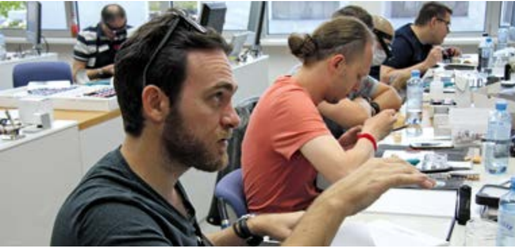
An den Expert Days bietet sich die Chance, Fragen zu stellen und sich persönliche Tricks und Kniffe bei den Kursdozenten abzuholen.